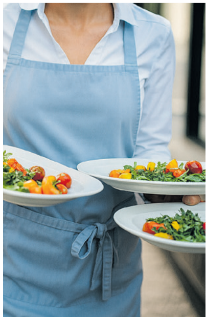
Im zweiten Quartal des Schweizer Gastrojahres gingen die Umsätze um 2,6 Prozent zurück.

Die aktuelle Lage zeigt: Die Herausforderungen für die Branche bleiben vielfältig. Wie gut einzelne Betriebe damit umgehen können, hängt stark von ihrer Anpassungsfähigkeit, ihrer Positionierung und ihrer finanziellen Ausgangslage ab.